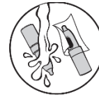
5. Puhdista ja kuivaa