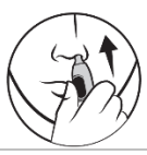
3. För in i näsan