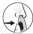
4. Tryck på knappen