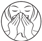
1. Niistä nenä