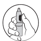
2. Tummen på knappen