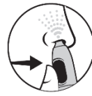
4. Tryck på knappen