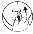
3. För in i näsan