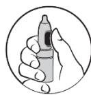
2. Tummen på knappen