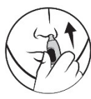
3. För in i näsan