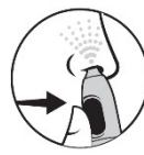
4. Paina annospainiketta