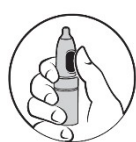
2. Tummen på knappen