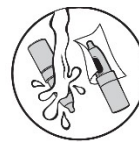
5. Rengör och torka