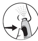
4. Tryck på knappen