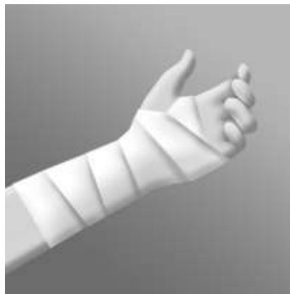
Vira förbandet längs armen, upp över handleden och fäst det. Byt förbandet två gånger om dagen, om inte läkaren föreskriver annat.