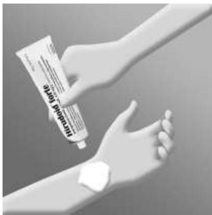
Applicera emulsionskräm på handleden.