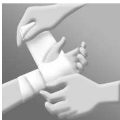
Bind in handleden med ett elastiskt förband först i riktning mot handflatan. Linda förbandet runt tummen och sedan över handflatan och klipp ett hål i förbandet för tummen på följande varv.